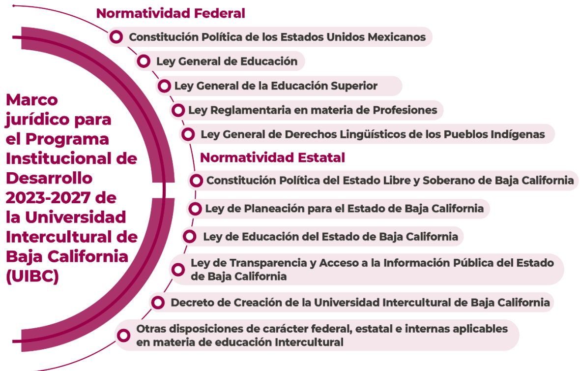
Figura 2. Marco jurídico para el Programa Institucional de Desarrollo (PID) 2023-2027

Fuente: Elaboración de Coplade con datos proporcionados por la UIBC.