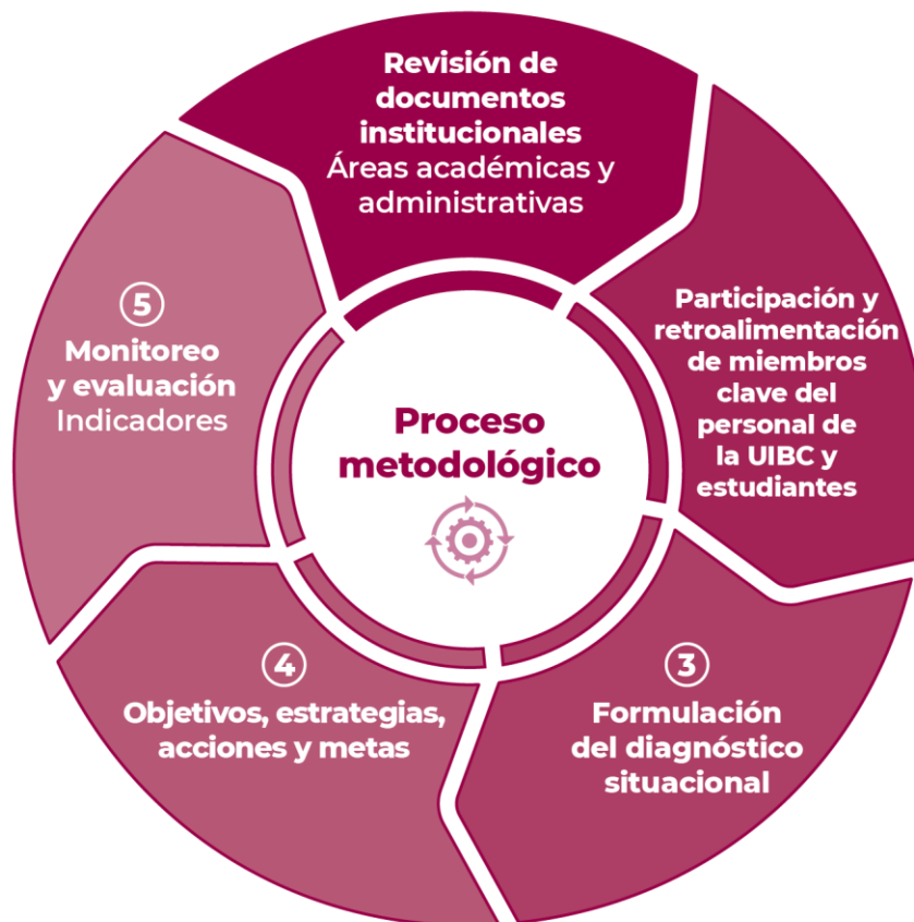
Esquema 1. Etapas del proceso de formulación del PID 2023-2027

Fuente: Elaboración de Coplade con datos proporcionados por la UIBC.