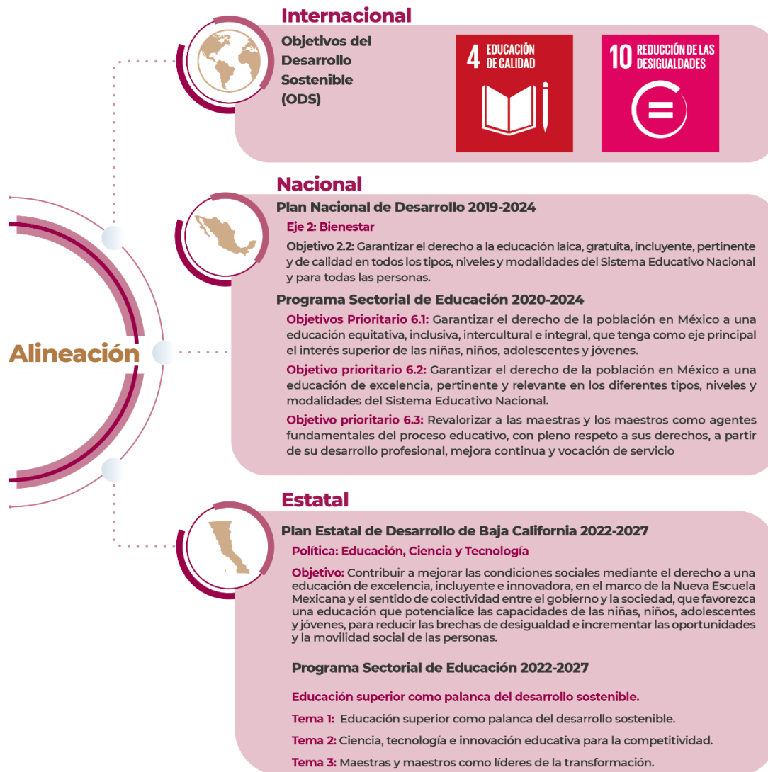
Figura 1. Alineación del Programa Institucional de Desarrollo (PID) 2023-2027

Fuente: Elaboración de Coplade con datos proporcionados por la UIBC.