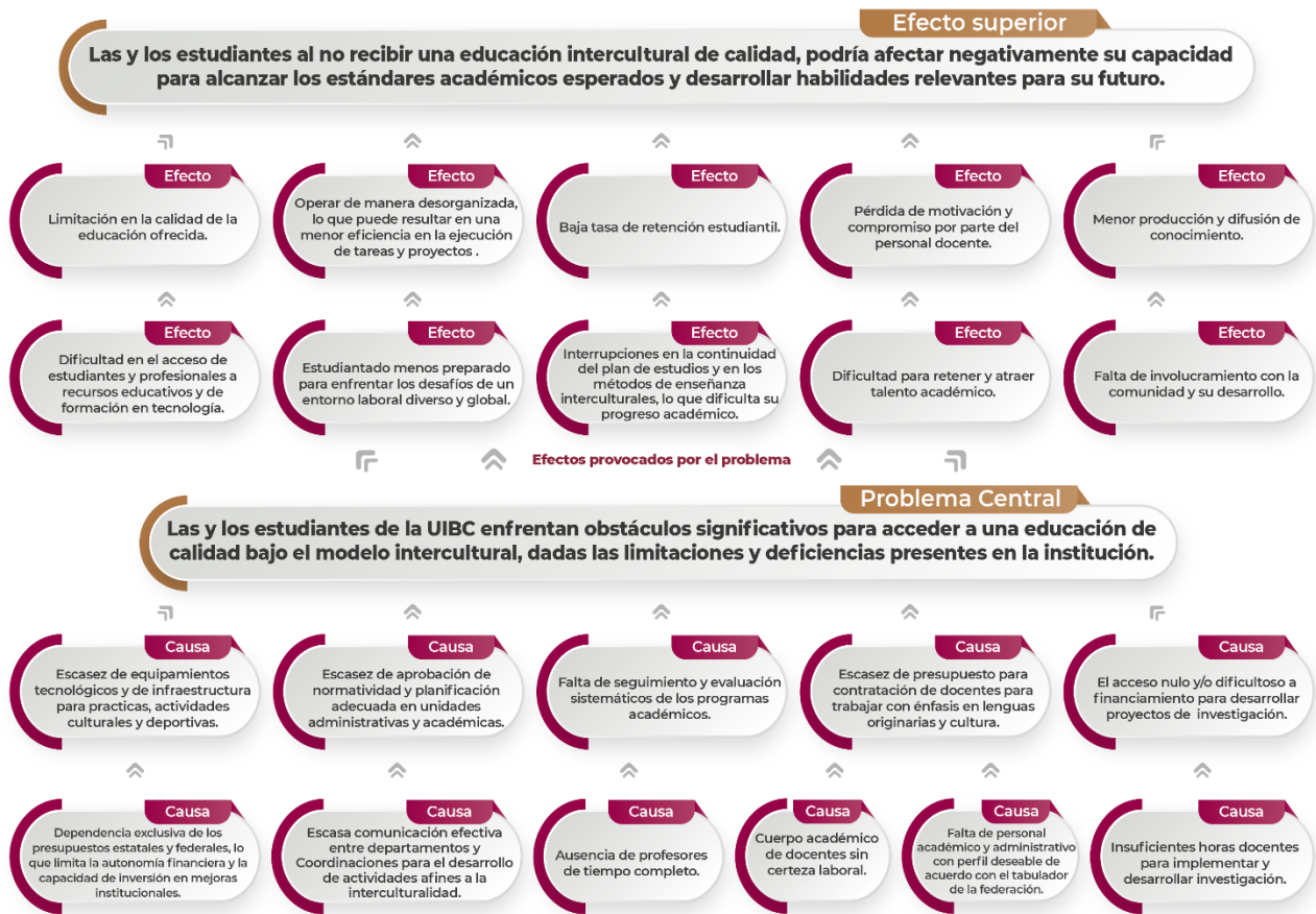
Esquema 2. Árbol de problemas